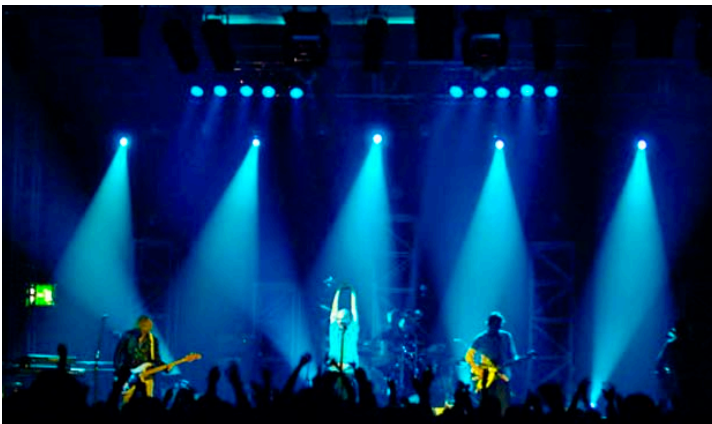
Luces, candilejas, oropel.